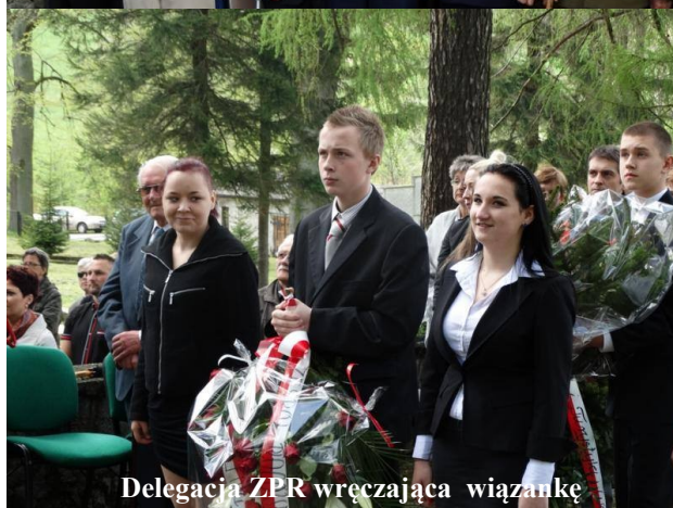
Delegacja ZPR wręczająca wiązanek