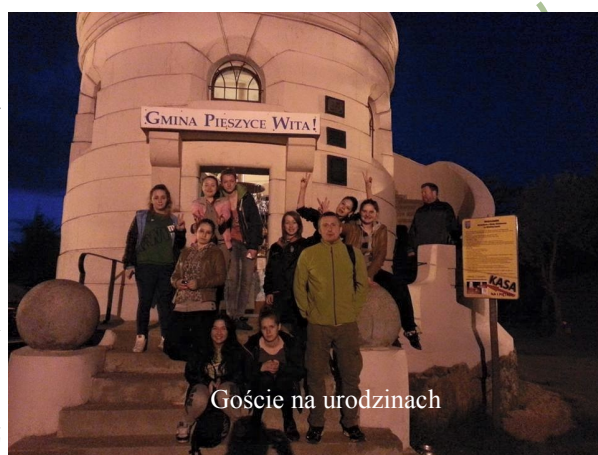
Goście na urodzinach

Zachęcam wszystkich, którzy lubią górskie wędrówki tego typu doświadczeń. Je-