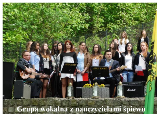
Grupa wokalna z nauczycielami śpiewu

poświęconych II wojnie światowej. To właśnie to ostatnie zadanie budziło u nas największą emocji, ponieważ nigdy do tej pory nie śpiewaliśmy na tak ważnej uroczystości środowiskowej. Jednak panująca w trakcie atmosfera podniosłości wpłynęła na nas