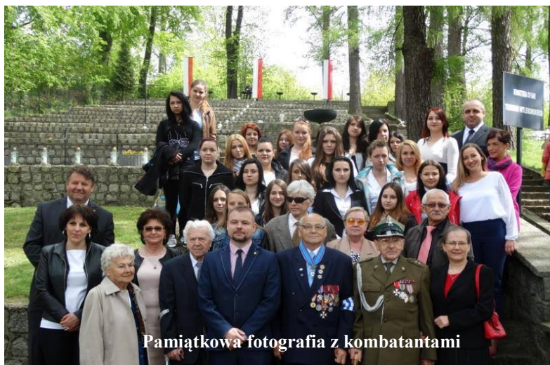
Pamiętkowa fotografia z kombatantami