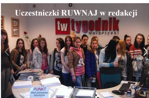
Uczestniczki RUWNAJ w redakcji

Następnie zasiadliśmy przy stole, przy którym co tydzień odbywa się kolegium redakcyjne i wspólnie z panią redaktor rozmawialiśmy o ostatnim wydaniu Tygo-