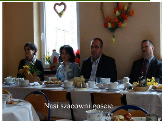
Nasi szacowni goście

wszystkich i składając życzenia wielkanocne. Następnie odbyło się poruszające przedstawienie, a emocje sprawiły, że nie